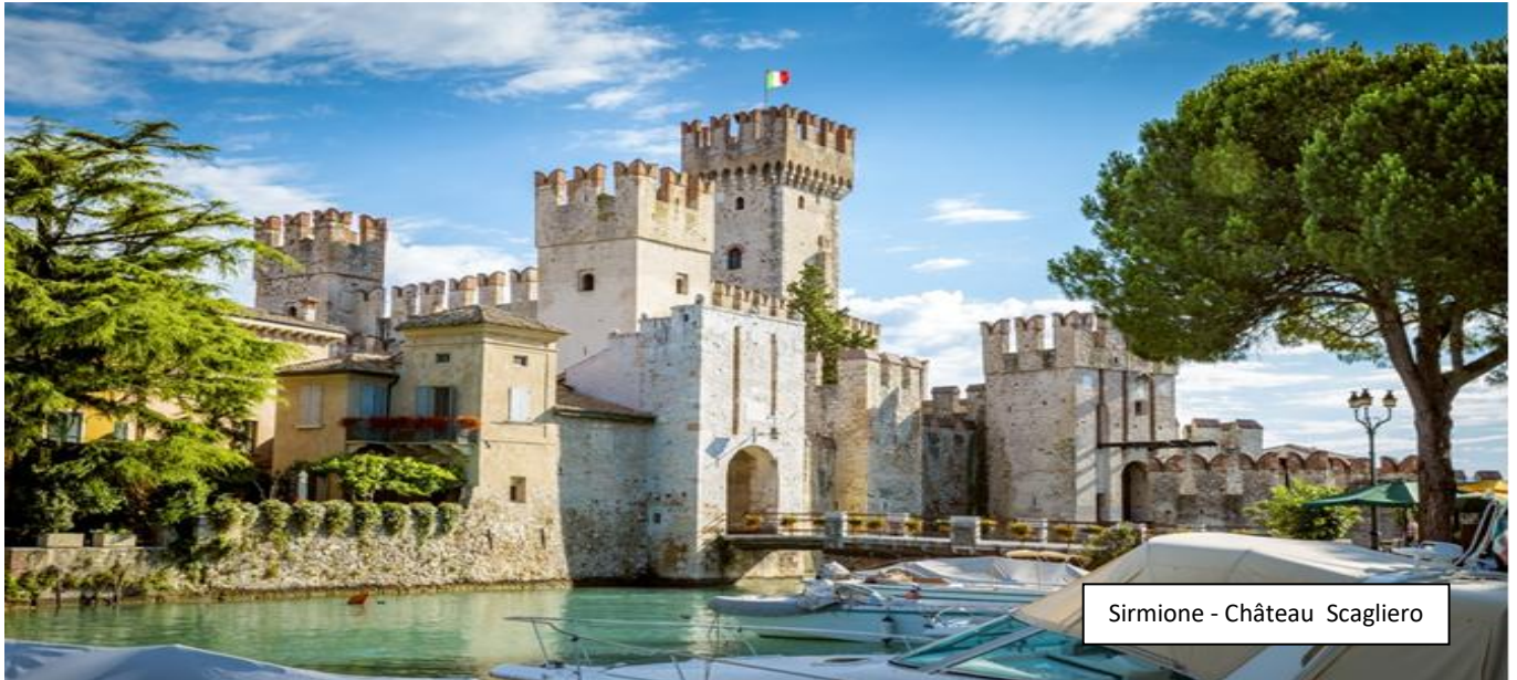
Sirmione - Château Scagliero

En début d'après-midi, nous atteindrons Sirmione , la petite ville regorge de merveilles qui rendent la visite de cette péninsule à la fois riche et agréable. En franchissant le pont du château, on entre dans l'ancien bourg. Le premier monument qui accueille les visiteurs est l'imposante Rocca Scaligera (visite extérieure), suivie par l'église Santa Maria Maggiore , construite au XVe siècle, et la plus ancienne, l'église San Pietro in Mavino , érigée selon la tradition par des pêcheurs locaux au VIIIe siècle au point le plus élevé de la péninsule. Sirmione est également réputée pour ses célèbres thermes, choisis chaque année par plus de 40 000 patients pour des cures. Non loin des Thermes de Catulle , on peut admirer (uniquement de l'extérieur) ce qui fut la villa de Maria Callas, ou plus précisément de son mari, Giovanni Battista Meneghini, riche entrepreneur véronais. Retour à l'hôtel pour le dîner et la nuit .